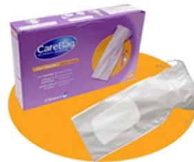
Care Bag® URI Care Bag® URI Verpackung