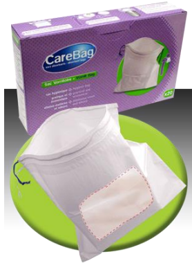
Care Bag® VOM Brechbeutel Verpackung CareBag® VOM mit 20 Stück

Das absorbierende Vlies verfestigt innerhalb kürzester Zeit bis zu 450 ml organische Flüssigkeiten.